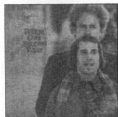
「明日に架ける橋」 ／サイモン&ガーファンクル

NSPのメンバーはもちろん、これを眺まれてるファンの皆さんにも好きだった方は多いはず。素敵なメロディとハーモニーが織りなす名曲揃いの作品。