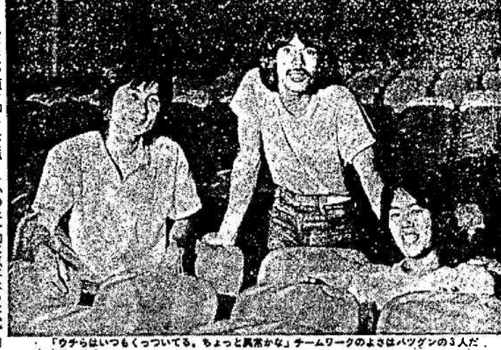
「ウチらはいつもくっついてる。ちょっと真実かな」チームワークのよさはバツグンの3人だ。

光る気はない。顔を知られて罵られる存在に魅力はあるが、ライバシーが失われる。その意味では今の状態は住み心地がいい。あるとは思わない。客席にいて中村「電車に乗っても騒がれない」