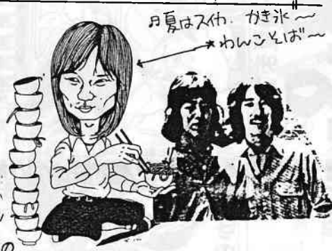
◎夏だと云うのに 真白な肌で情け無い。 仕事のために 夏休日も消えて、たぶん ナチス たくち、はらたの+!...。せ。大人のイメは。