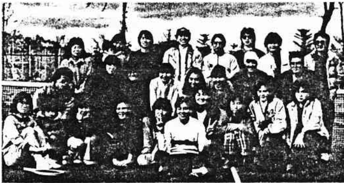
記念すべき First Sailing ハイポーズ!!