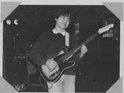
ローディーの牛窪。ギターをかかえ、僕のマネをしているところ。脚の長さが僕と全然違う。