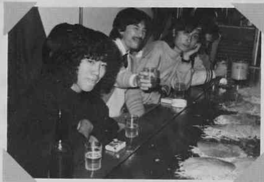
広島のお好み焼き屋で。焼けるのが遅くてみんなイライラ。