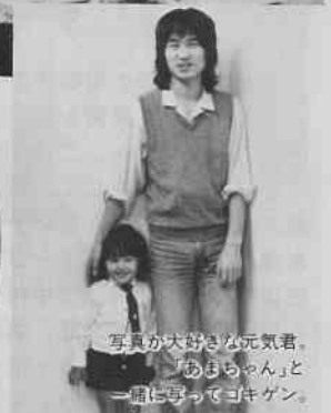
写真が大好きな元気君。「あまちゃん」と一緒に写ってヨキゲン。