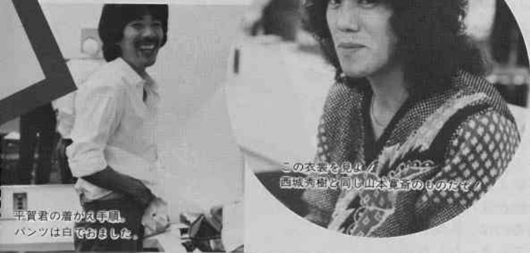
この衣装を見せろ！ 西城秀樹と同じ山本真幸のものだよ！