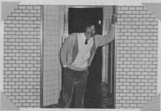
トイレから出てくる瞬間。実はしている最中も撮ったのですが、本人の希望でボツになった。