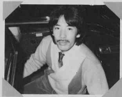
車から降りる瞬間。こんないい顔はめったに見れない。