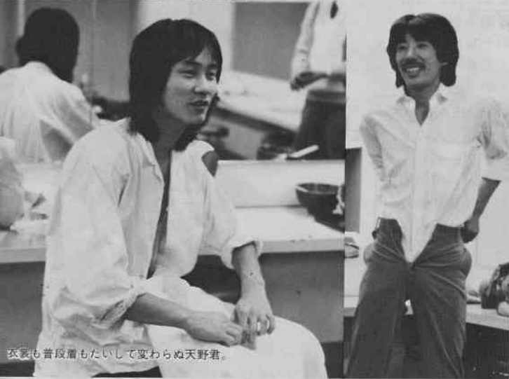
衣装も普段着もたいして変わらぬ天野君。