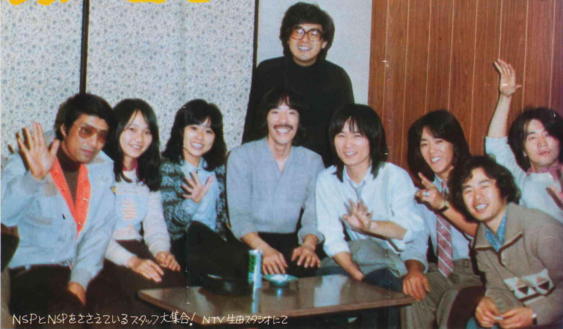
NSPとNSPをささえているスタッフ大集合! NTV生田スタジオにて